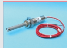
Thermomelder THM 1