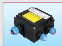
Klemmkasten KK2 ATEX