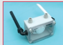
By-Pass Rauchmelder BRM 1